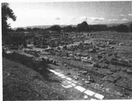
现存的腓立比遗址

在第二次宣教旅程中，圣灵带领保罗向马其顿去，以腓立比为开始工作的基地（徒十六9-10）。城内并没有会堂，保罗只能来到城外一个祷告的地方，从在那里聚会的一名悔改归主的妇女领袖吕底亚开始事工，然后在她家中聚会（徒十六13-15，40）。有些人认为第一个“我们”段（路加是使徒行传的作者，以“我们”记述保罗的行程，表示路加当时开始加入保罗的同工行列）在腓立比开始（徒十六10），也在腓立比结束（徒十六40），暗示路加在保罗离开后仍留在这城里，继续建立教会。后来在第三次旅程中，保罗途经腓立比时，路加再次加入保罗的行列（徒二十6）。