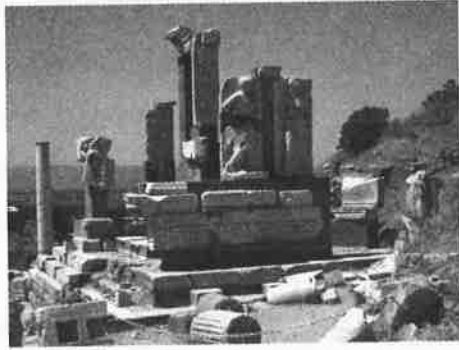
现存的以弗所遗址

后，亚波罗、百基拉亚居拉夫妇、提摩太和约翰都曾在这里牧养教会（林前十六12，19；提后四19）。