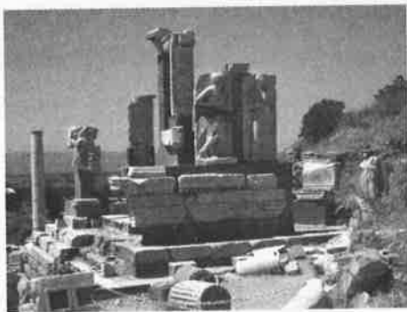
现存的以弗所遗址

后，亚波罗、百基拉亚居拉夫妇、提摩太和约翰都曾在这里牧养教会（林前十六12，19；提后四19）。